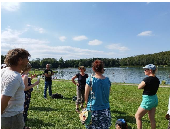
Parc Marcel Cabiddu, Lecture en paysages, Wingles

Les Journées nationales de l'architecture, ce sont 3 jours pour mettre en valeur une discipline qui rythme notre quotidien, dessine la ville de demain, œuvre au vivre-ensemble. L'architecture est partout, tout le temps, elle se vit concrètement sans que l'on s'en aperçoive : constructions nouvelles, aménagements urbains et paysagers attentifs aux circuits courts et matériaux locaux témoignent de la trajectoire de notre territoire respectueux de son passé et inscrit dans les grands défis du temps !