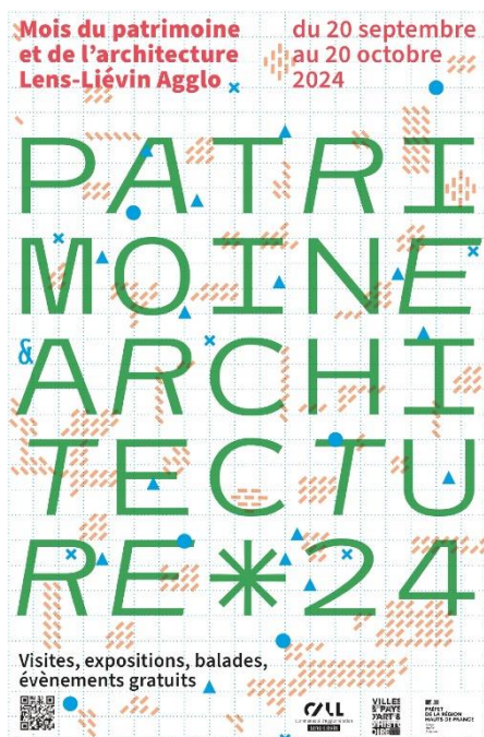
Affiche Mois du patrimoine et de l'architecture 2024