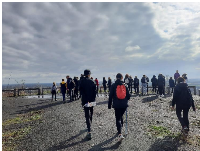
Terril de Pinchonvalles, Rando visite, Liévin

La thématique n'est pas obligatoire , les ouvertures d'églises, visites de lieux exceptionnels et spectacles en lien avec les patrimoines quels qu'ils soient sont évidemment possibles. Les journées du patrimoine constituent avant tout une grande fête des patrimoines !